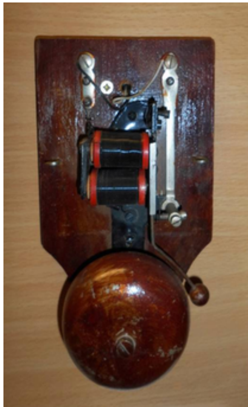
Bild3: Geöffnete Klingel mit einem Wagnerschen Hammer

Die Klingel enthält einen "Wagnerschen Hammer", siehe folgendes Bild.