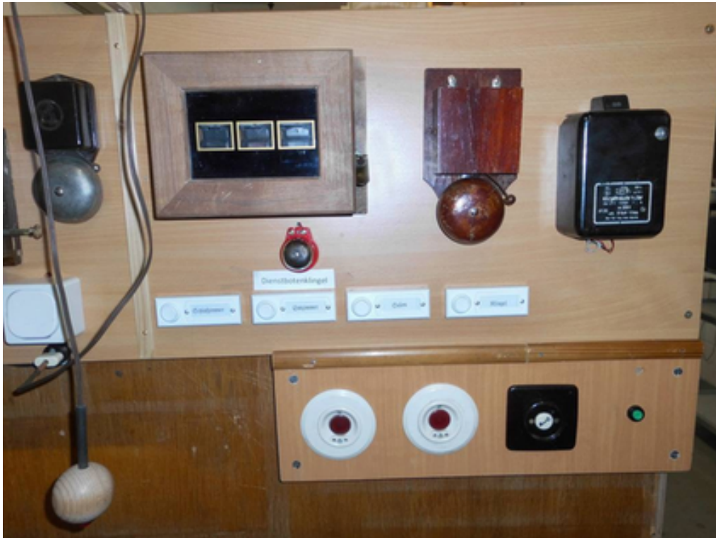
Bild7: Fertige Dienstbotenklingel-Anlage

Den vollständigen Aufbau im Energie-Museum in Berlin zeigt das folgende Bild (Stand März 2020).