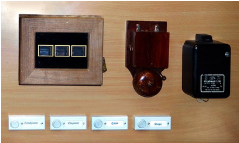
Bild1: Dienstbotenklingel-Anlage im Energie-Museum-Berlin

In herrschaftlichen und vielen gutbürgerlichen Haushalten gab es früher "Dienstbotenklingel-Anlagen". In den Zimmern der "Herrschaften" waren Klingelknöpfe, und in der Küche gab es eine Klingel und eine Anzeigetafel, die zeigte, in welchem Zimmer "gerufen" (geklingelt) wurde.