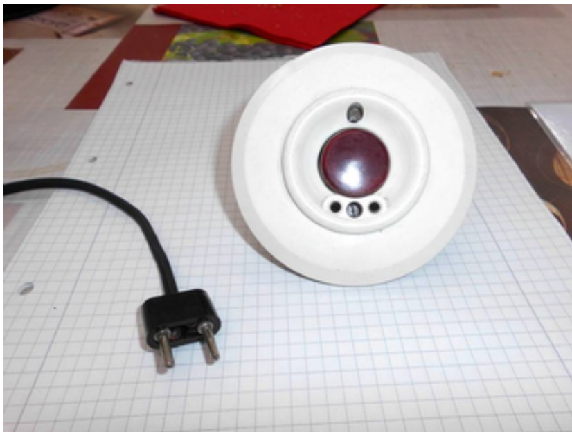
Bild6: Klingelknopf (Unterputz) mit Anschlusskontakt für mobilen Klingelknopf

Zwei Unterputz-Klingelknöpfe mit Anschlusskontakt für mobile Klingelknöpfe befinden sich im Energiemuseum, passten aber nicht auf das Brett mit der Dienstbotenklingel-Anlage, siehe folgendes Bild.