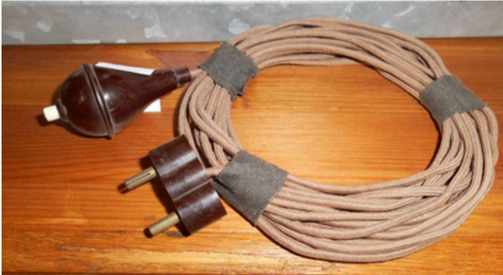
Bild5: Mobiler Dienstboten-Klingelknopf

Viele mobile Klingelknöpfe hatten eine Birnenform. Die Stecker hatten anfangs (in der Kaiserzeit) noch fast die gleichen Maße wie Stecker für Lampen oder für externe Lautsprecher, Schallplattenspieler usw., später setzten sich dann aber unverwechselbare Maße durch.